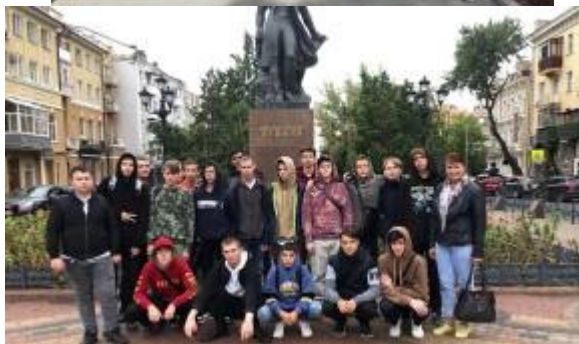
Экскурсия в музей краеведения музей искусств на Пушкинской