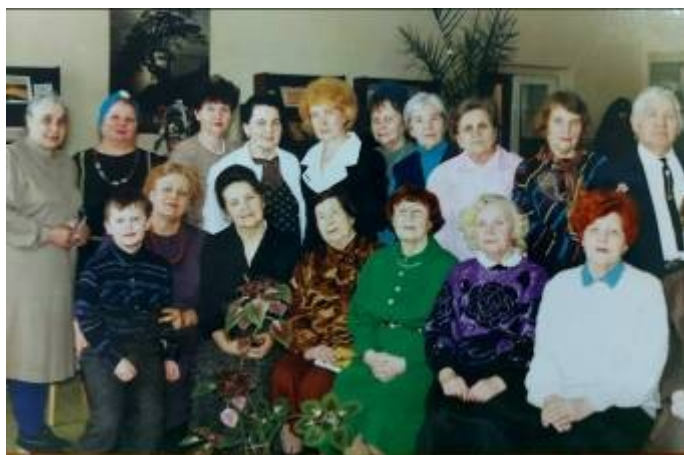
Литературно-музыкальный салон «Шестое чувство»

Возможно, это дерзость с моей стороны, но я всё-таки рискну в своей грешной жизни найти лирическую ноту.