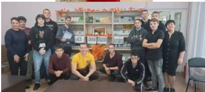
Экскурсии в библиотеки города Батайска